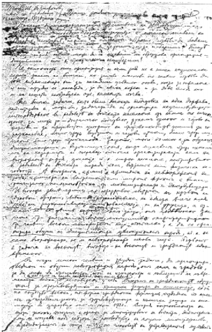
Фиг. 4. Факсимиле на радио-сказка на проф. Трифонов: „...Докато думата „организация“ е символ на ред, дисциплина, издръжливост, победа, „дезорганизацията“ е печален символ на безредице, неоправия, паника и погром. Прочее, следва да бъдем организирани, ако искаме да успеем и да победим. Блазе на онзи народ, който може да се похвали с образцова организация и дисциплина... Че склонност към организация и към ред не е наша национална черта, знаем го всички...”