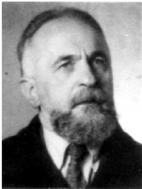
Фиг. 3. Проф. Иван Трифонов

Противохимическата защита е успешна, ако не само войската, но и цялото население са готови за нея. Ето защо държавата е имала грижата да организира тази дейност до степен, че всеки град или село да разполагат с команди, които изпълняват следните функции: наблюдателно-химическа, сигнална, маскировъчна, чистачна (обезгазяване), санитарна, пожарна и полицейска. Всяко семейство разпределя длъжностите си, за да знае всеки член какво да прави при опасност. Съюзът на гражданските сдружения по противовъздушната и химическата защита на населението в Царството 8)