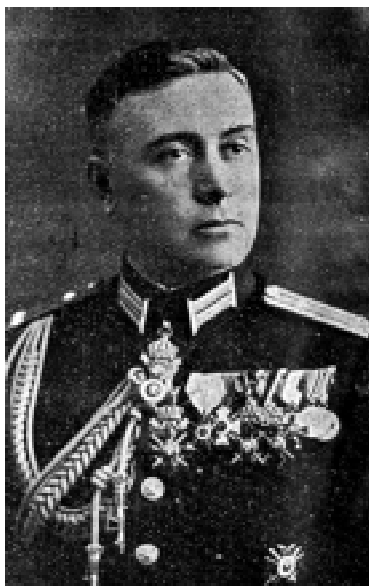
Фиг. 1. Инж.-химик ген. Христо Велчев

На въоръжение в българската войска, освен малки количества германски газови маски в цилиндрични кутии, е българската противогазова маска тип ДВФ.